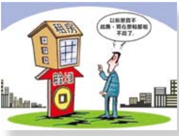
大城市規模的擴張，低收入群體的住房與日益攀升的房價、房租成了難以調和的矛盾。

由於群租現象對社區安全、居民人身財產安全等方面的眾多危害。因此，對於大陸高校畢業生來說，如果選擇群租，不僅自己要承擔治安、消防、衛生、環境等多方面的安全風險，也難以真正意義上做到安心居住。