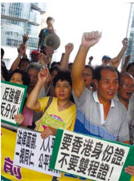
早年內陸移民至今仍爭取子女居港權

如果還爬得動，往山上走的時候，左邊有「域多利監獄」，算是古蹟；電扶梯右邊則有「孫中山紀念館」，詳細法可上網再查。很多電影常出現長一條水泥階梯坡，兩邊兒很多綠色帆布的棚攤，其實就是這一小區的主要印記。小攤很有趣，隨處都有，賣的物件也不一定，如果有時間的話，可以緩步查訪。這些區域何時、是否會「中環化」？誰也說不準，所以建議趁早為妙。