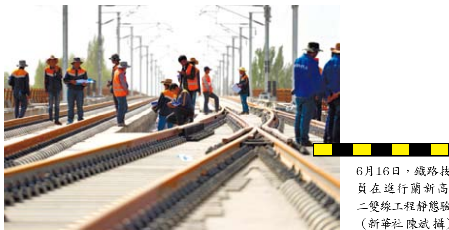
6月16日，鐵路技術人員在進行蘭新高鐵第二雙線工程靜態驗收。

員工賣幹、苦幹加巧幹。中鐵電氣化局全年無間斷施工，用不到兩年時間，讓數以十萬計的設備儀器、近7萬根接觸網線杆、上千間工房和複雜的線網全部就位。