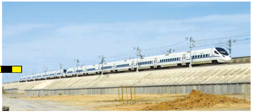
6月10日，在新疆吐魯番地區，蘭新高鐵上的和諧號動車正在「試跑」。