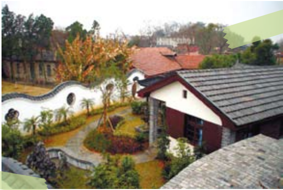
蔣經國主政贛南時的故居，1949年後歷經多種用途，包括幼兒園、冶金研究所等。

贛江水緩緩流動，一棟門牌號為「花園塘1號」的俄式磚木小樓依偎在贛州古城牆邊。這就是蔣經國主政贛南時的居所，如今成為開放參觀的文保單位。70多年光陰如流水，將周邊草木浸染得鬱鬱蔥蔥，也將曾經的政治、愛情、雄心歸於靜謐的風景，留待後人尋覓品味。