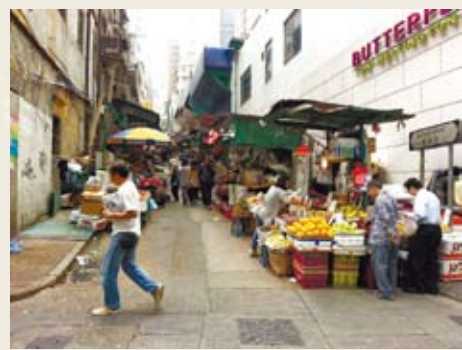
嘉咸街市場很熱鬧

如果你連新界都能熟，大概就堪稱香港通了。這也是逐漸遠離我們所熟悉的香港形象的過程。並且逐漸發現，越雜、亂的香港，因著生活的痕跡，才是更允許我們看見他們也看見我們自己的真實。