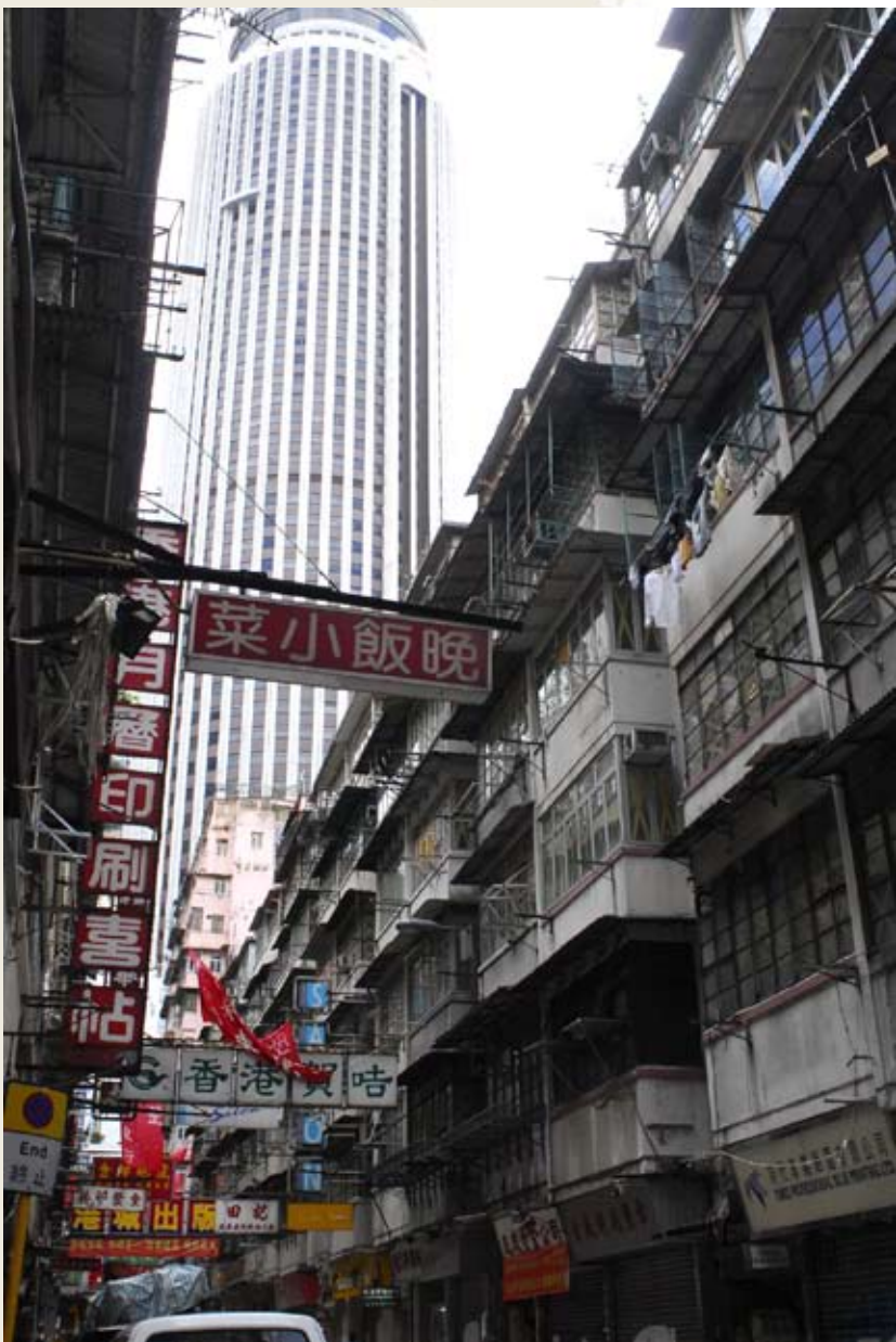
舊區與新樓（已清拆的利東街）