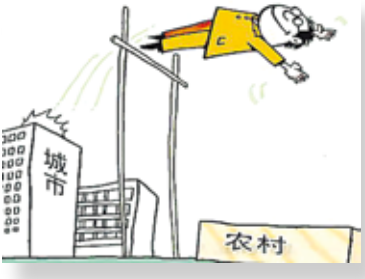
近年來越來越多白領從城市生活撤退了，他們離開的原因很簡單，想找回正在生活的感覺。（網路圖片）

村的生活與白領們習慣了的都市生活是完全不一樣的。回歸是要做一個農民，還是做一個擁有絕對經濟優勢的隱士，每個人臨行前，都應該拷問自己的心。否則，放棄工作，逃離大城市容易，經過鄉村一番歷練，再回到城市，卻很可能發現江湖早已不在。