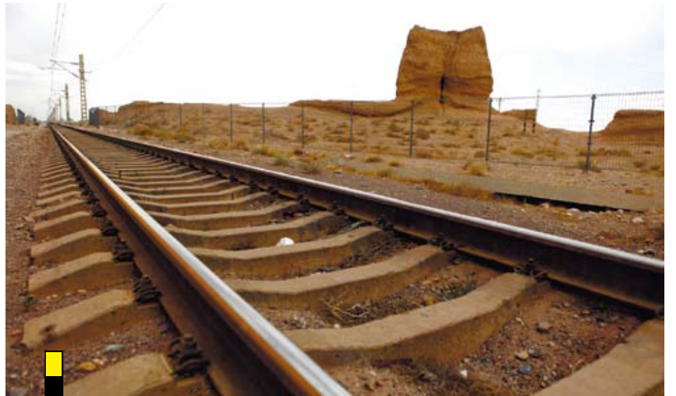
蘭新鐵路和古老長城交匯於嘉峪關的不遠處。